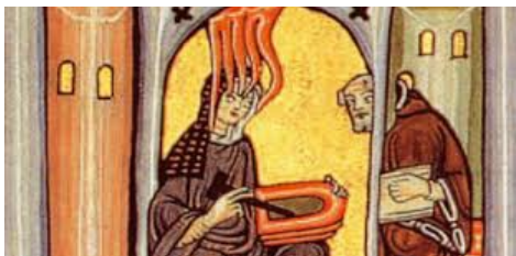
Hildegard empfängt Visionen

Ihre Funktionen : Benediktiner Schwester , Äbtissin , Dichterin , Komponistin, Seelsorgerin , Predigerin , Beraterin hoher Persönlichkeiten , Visionärin und bedeutende Universalgelehrte.