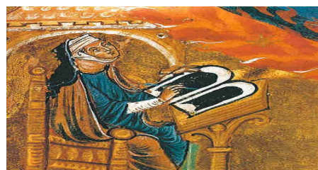
Hildegard beim aufzeichnen Ihrer Bücher